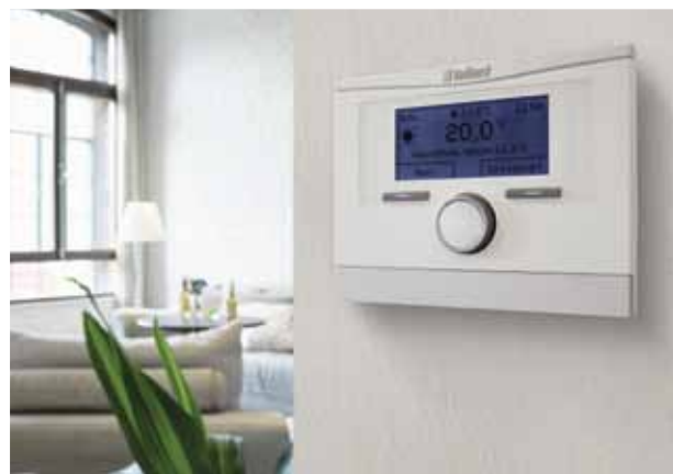
multiMATIC VRC 700

Du kan også sende os en e-mail på salg@vaillant.dk .