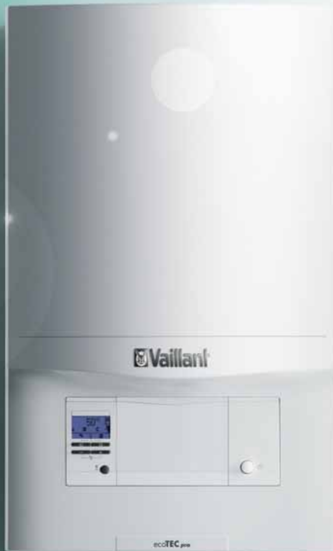
■ ecoTEC pro

The good feeling of doing the right thing.