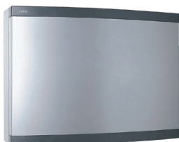
Kabinet til Termix Konv. 24

Konverteringsrørsættet gør det muligt at konvertere en Termix 20 til en Termix One eller Termix Novi.