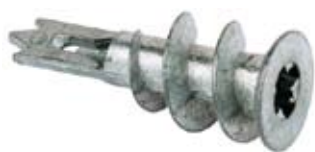
Gipspladedübel metal GKM