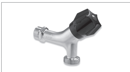
Aftapventil med kontra til vaske/opvaskemaskine