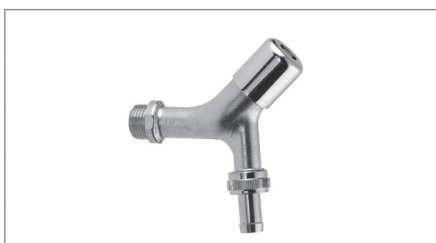
Aftapventil m/nippel, kontra og slangeforskruning t. nøgle