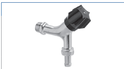
Aftapventil med nippel og slangeforskruning u/kontra