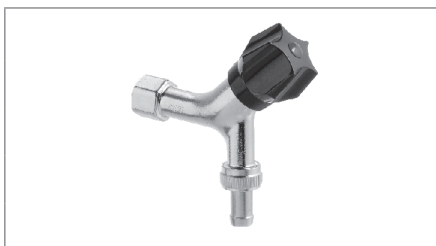
Aftapventil med muffe, kontra og slangeforskruning