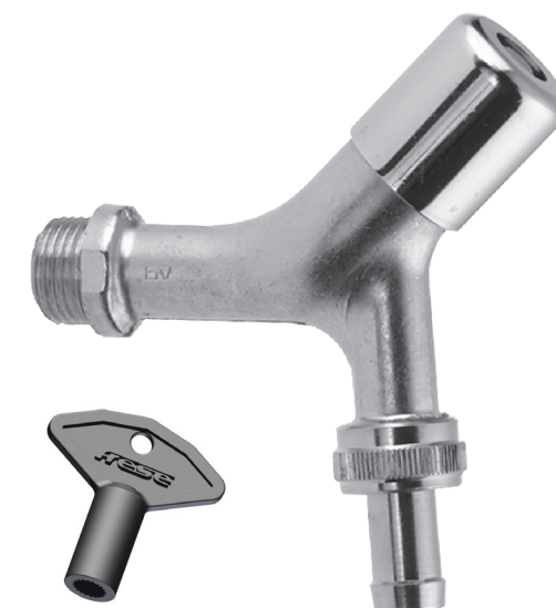
Frese nøgle til aftap