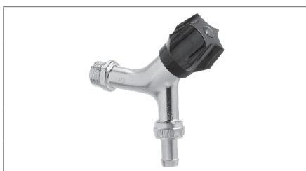
Aftapventil med nippel, kontra og slangeforskruning